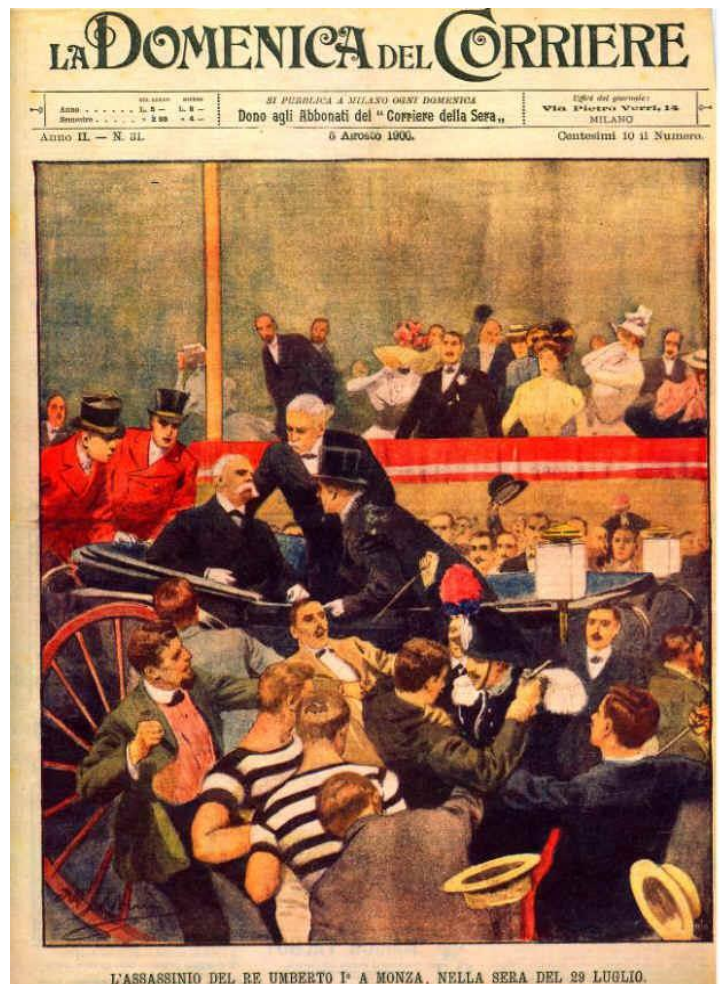
L'ASSASSINIO DEL RE UMBERTO I° A MONZA, NELLA SERA DEL 29 LUGLIO.

Ucciso anche il re Umberto I (1900) dall'anarchico Gaetano Bresci.